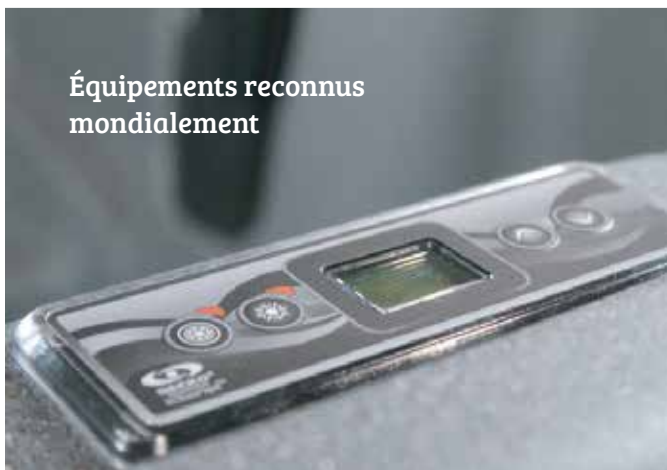
Équipements reconnus mondialement