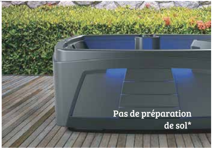
Pas de préparation de sol*