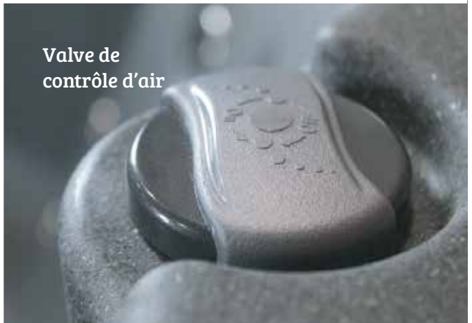
Valve de contrôle d'air