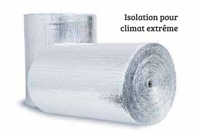
Isolation pour climat extrême