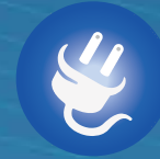
Brancher 120V (convertible 240V)**