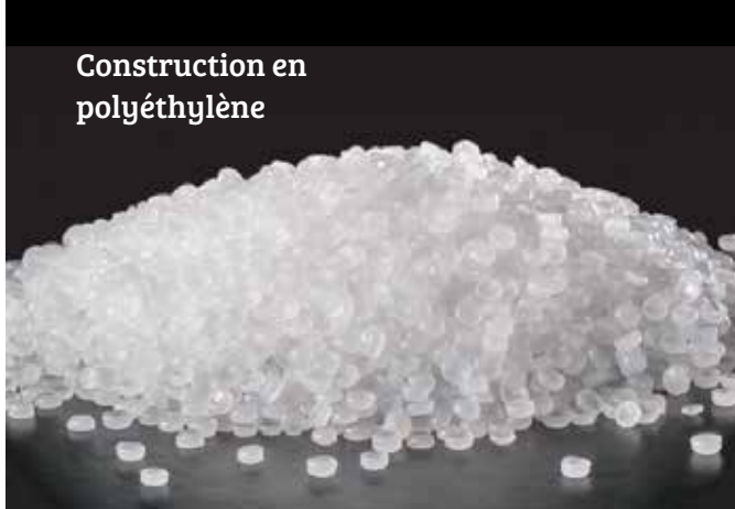
Construction en polyéthylène