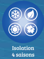
Isolation 4 saisons