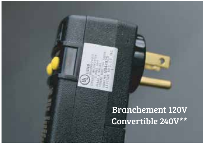
Branchement 120V Convertible 240V**