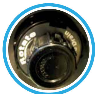
Valve de drainage extérieur

Images à titre indicatif. Les couleurs, les spécifications peuvent varier.