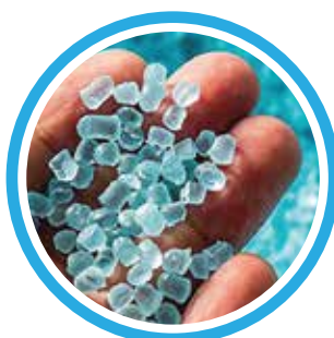
Moulé d'une seule pièce en polyéthylène