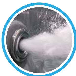
Jet turbo de 5 pouces