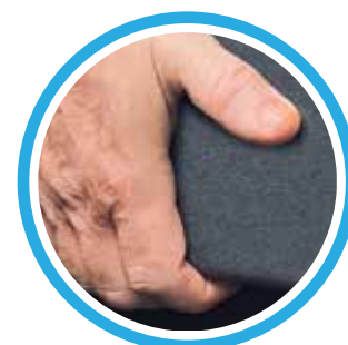
Transport facile avec poignées intégrées