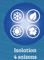
Isolation 4 saisons