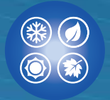
Isolation 4 saisons