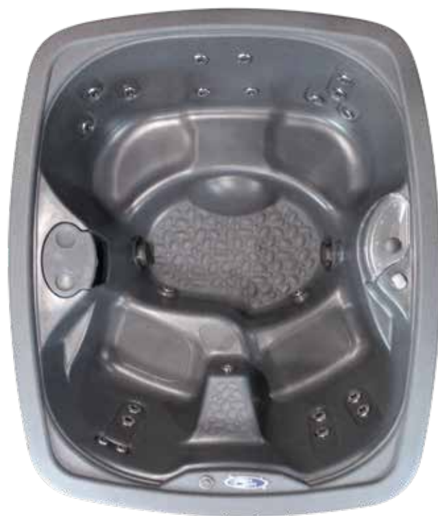
Images à titre indicatif. Les couleurs et les spécifications peuvent varier.